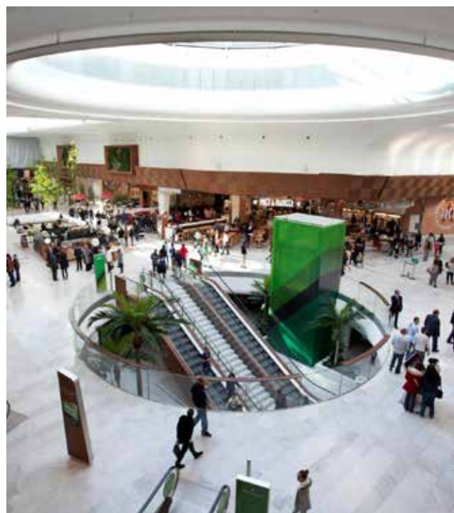
Centre de shopping Aéroville - Roissy-en-France

Avec 47 millions d'utilisateurs en France (4) , Internet s'est imposé comme un canal de prescription d'achats et les Français sont, parmi les Européens, les consommateurs ayant le plus intégré le multicanal dans leurs comportements d'achat.