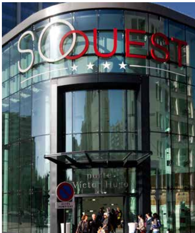
Centre de shopping So Ouest - Levallois-Perret

Cet accompagnement sur-mesure sur une période longue vise à encadrer, stimuler et aider les jeunes entrepreneurs en leur donnant accès aux conseils d'experts sur des connaissances indispensables à leur réussite (marketing, management, gestion administrative et juridique).