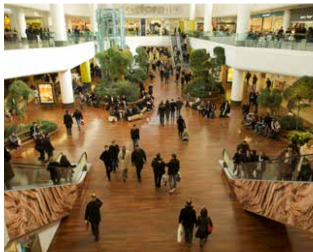
Centre de shopping les Quatre Temps - Paris La Défense

La clef du succès pour les commerces de demain ne repose donc plus sur une consommation de masse, mais sur la différenciation et l'expérience shopping proposée aux clients. La réussite des jeunes créateurs repose donc désormais dans leur capacité à proposer des produits et des services très différenciants à forte valeur ajoutée (SAV, système de fidélité, accueil, conseil, achats multicanaux...).