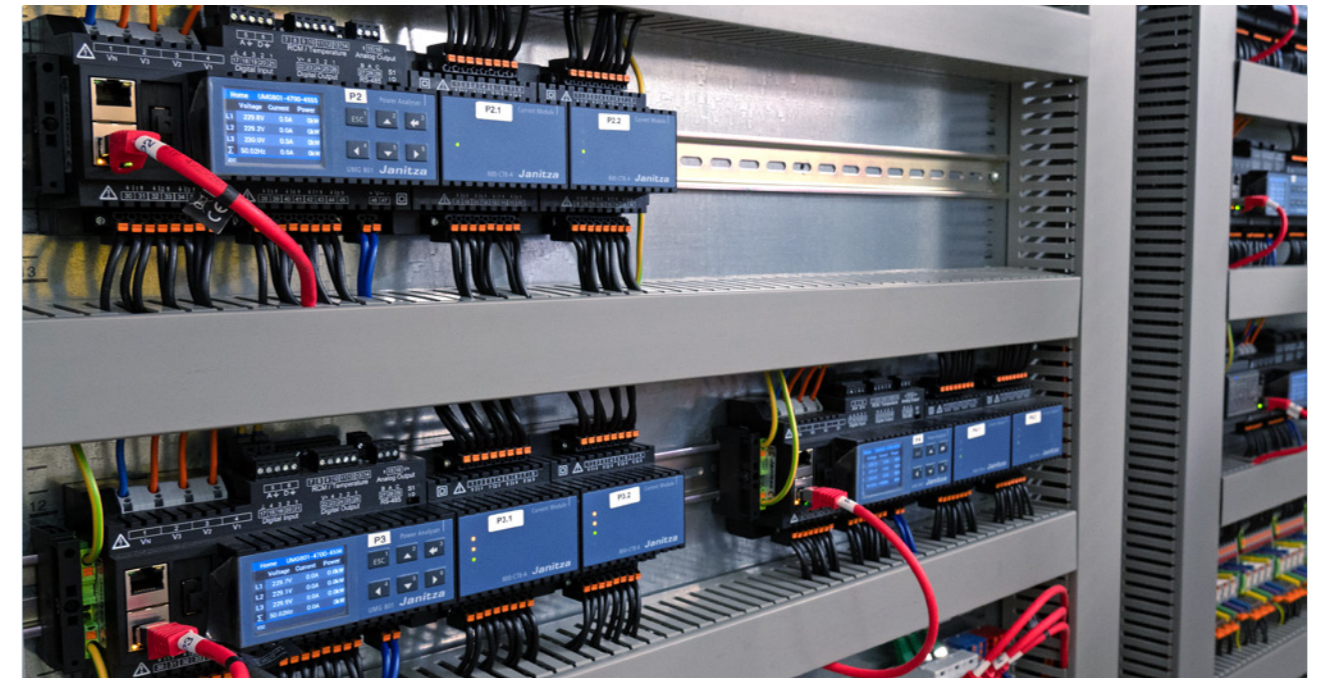
El analizador de potencia modular ampliable UMG 801 se puede ampliar con módulos