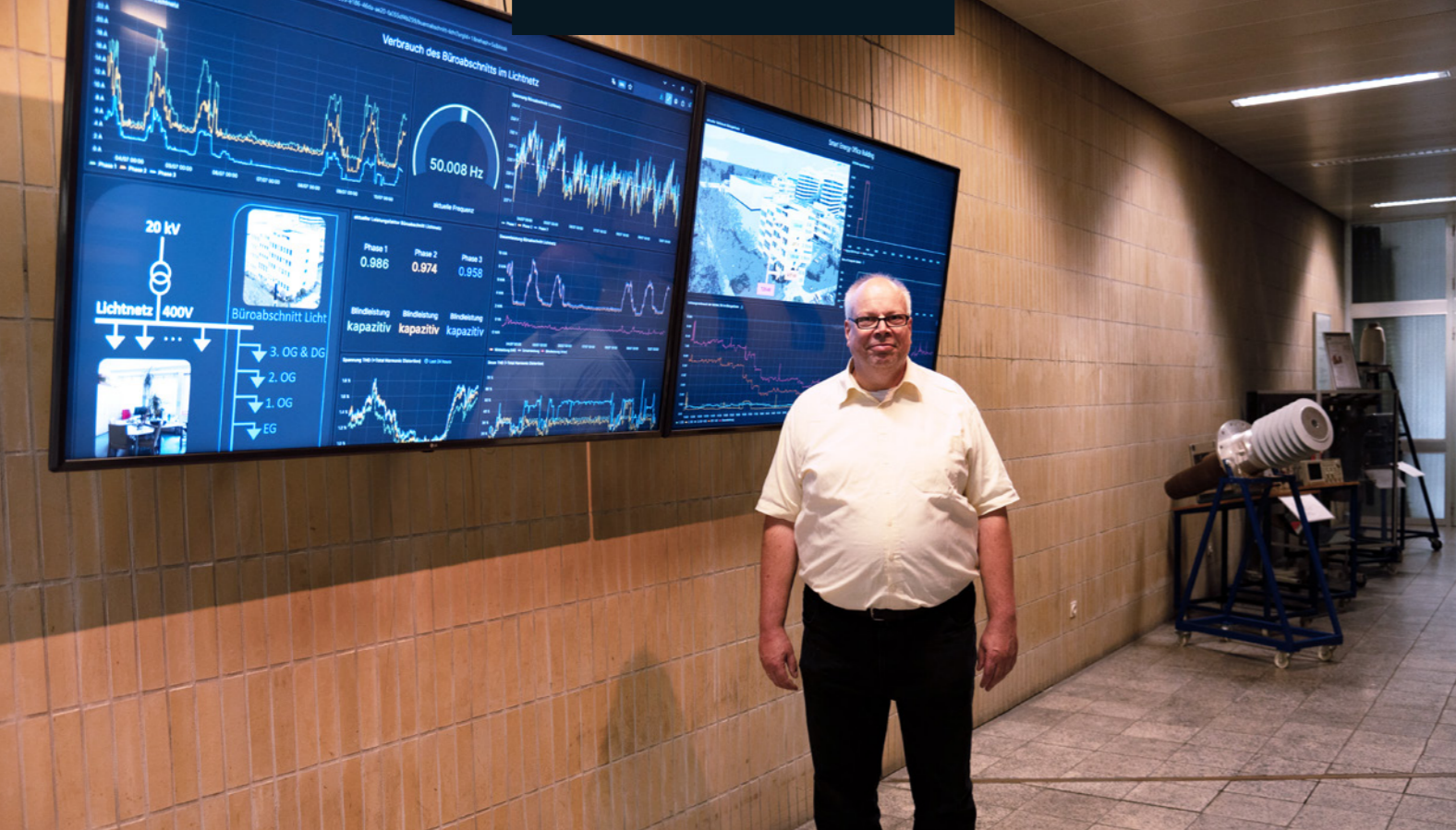
Las pantallas situadas en la zona de entrada proporcionan información sobre el consumo energético del edificio